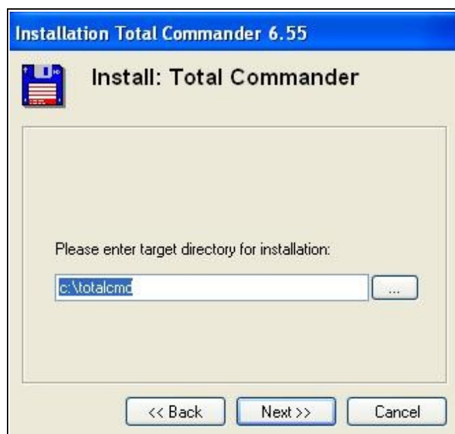
Rysunek 2. Ścieżka do instalacji programu.

W kolejnym kroku instalator zapyta nas gdzie chcemy zainstalować program. Domyślnie jest to c:\totalcmd. Po wybraniu ścieżki instalacji programu klikamy w następnych krokach na „Next”. Po zakończeniu instalacji program jest gotowy do użycia.